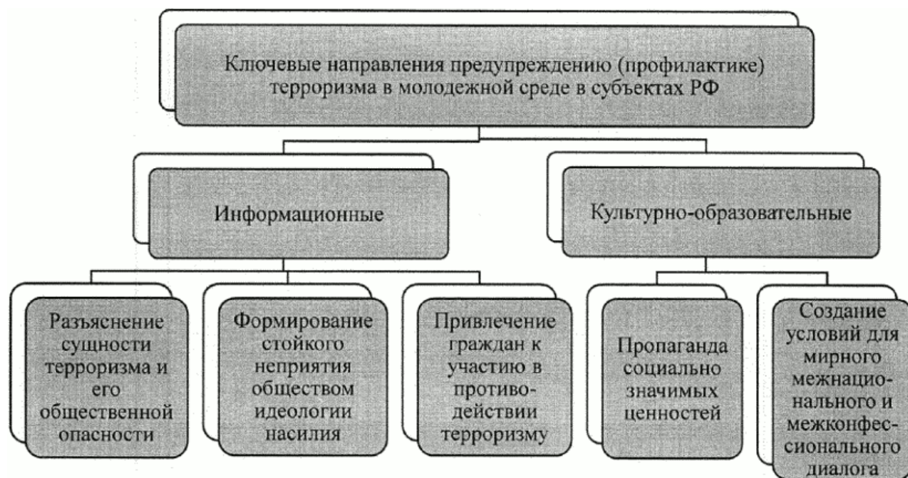
Рисунок 1. Ключевые направления по предупреждению (профилактике) терроризма

культурно-образовательные (пропаганда социально значимых ценностей и создание условий для мирного межнационального и межконфессионального диалога) (см. рисунок 1).