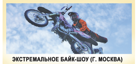
ЭКСТРЕМАЛЬНОЕ БАЙК-ШОУ (Г. МОСКВА)