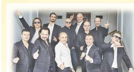
КОНЦЕРТНАЯ ПРОГРАММА «ПРАЗДНИК ПЕСНИ» В ИСПОЛНЕНИИ АРТ-ГРУППЫ «ХОР ТУРЕЦКОГО» (Г. МОСКВА), ПОД РУКОВОДСТВОМ НАРОДНОГО АРТИСТА РОССИИ МИХАИЛА ТУРЕЦКОГО