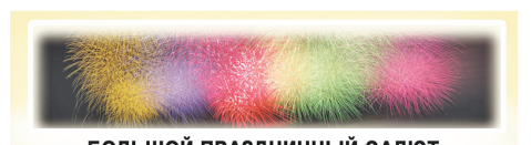
БОЛЬШОЙ ПРАЗДНИЧНЫЙ САЛЮТ