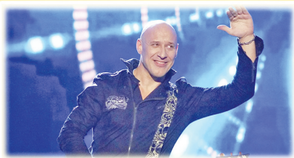
КОНЦЕРТНАЯ ПРОГРАММА В ИСПОЛНЕНИИ АВТОРА И ИСПОЛНИТЕЛЯ, ЗАСЛУЖЕННОГО АРТИСТА РОССИИ ДЕНИСА МАЙДАНОВА (Г. МОСКВА)